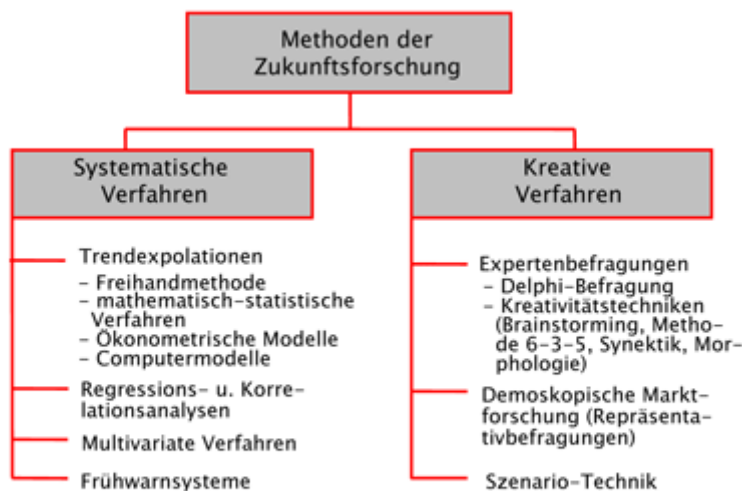
Abb. 1: Methoden der Zukunftsforschung (Übersicht)

Die meisten dieser Zukunftsforscher gehen von einer deterministischen Gesellschaftsauffassung aus, das heißt sie unterstellen, dass die heutige und morgige Entwicklung auf Entwicklungen in der Vergangenheit zurückgeführt werden kann. Unerwartete Ereignisse, wie Terroranschläge, Naturkatastrophen oder Seuchen, sind nur schwer in diese Modelle zu integrieren. Sie werden als „Störvariablen“ oder „(Entwicklungs-)Brüche“, neuerdings als Konzept der „Wild Cards“, erwähnt.